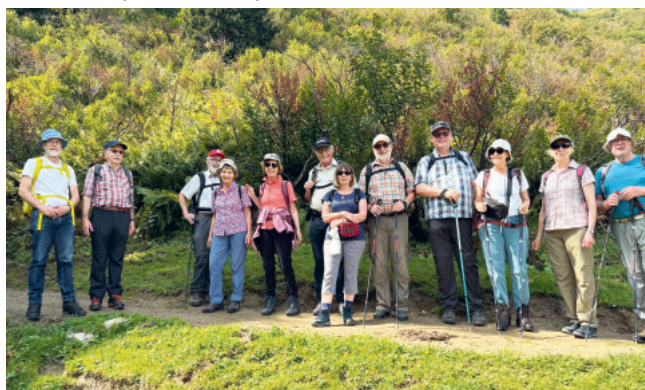
Wanderung Gruppe für fröhliche Anlässe