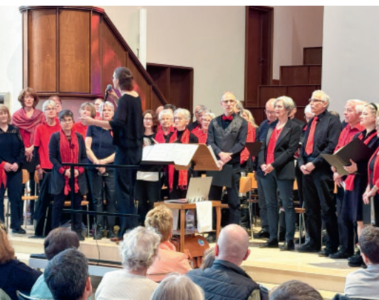
Gottesdienst mit Gospelfriends