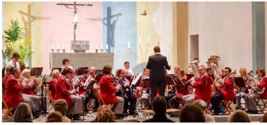
Die MG Aadorf überzeugte mit zwei vorzüglichen Kirchenkonzerten und einem reich bestückten Apérobuffet.